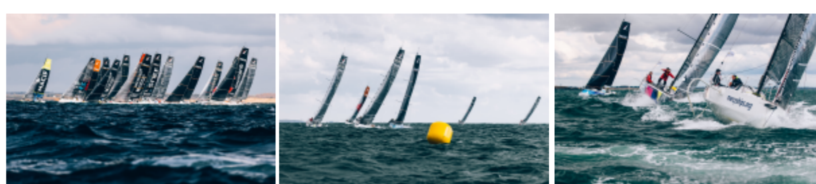
Cliquez sur les photos afin de les télécharger. D'autres images sur la DROPBOX DE LA COURSE